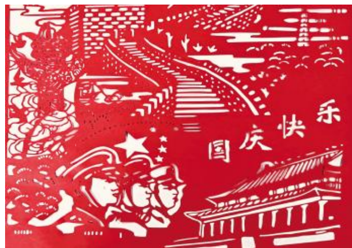
《红纸映国辉 剪韵庆华诞》李鑫 作

“够不够阿姨”用她的热情和爱心，温暖了项目上我们每一个人的心。在她的照顾下，我们不仅吃得好，心情也变得愉悦。远在异乡的日子里，她就像一位慈祥的母亲，让我们感受到了家的温暖。