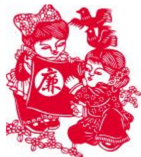
《廉洁共护》杨鸿英 作