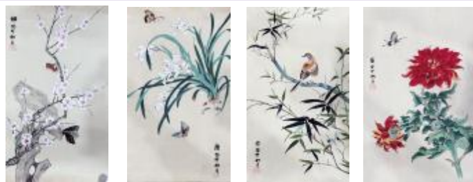
《梅兰竹菊》高国红 作

正如已经来了两年的同事说的那样，你们现在看到的孟底沟，已经好了太多了，而我也希望你能告诉两年后的同事，你看，它现在真的很好。