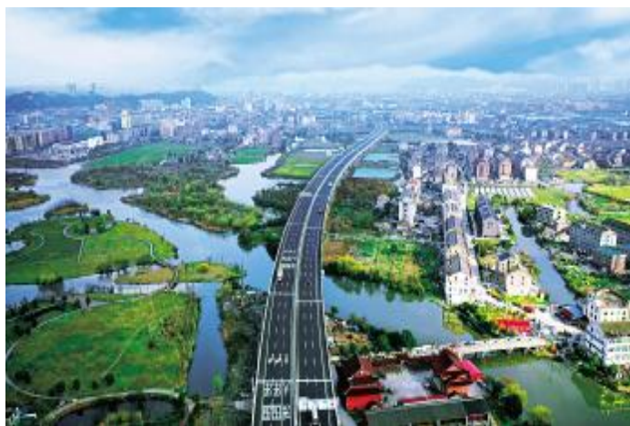
《“玉带”犹抹青绿》