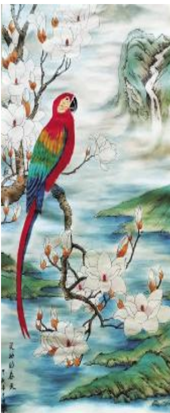
《灵动的春天》高国红 作