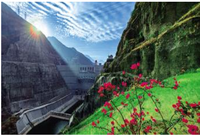
《花动一山春色》张珍 摄