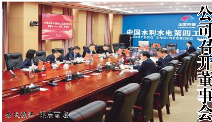
会议现场

公司高管、总部各部门中层副职以上人员及二级单位班子成员、各部门负责人分别在主、分会场参加部署会议。