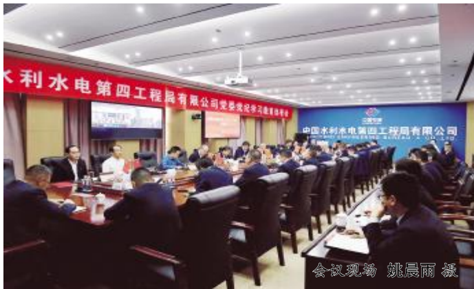
会议现场

会议指出,开展党纪学习教育是以习近平同志为核心的党中央作出的重大部署,是加强党的纪律建设、推动全面从严治党向纵深发展的重要举措。领导班子成员要带头学习、知纪明纪,作出表率,要对照党章党规找差距,把纪律和规矩挺在前面。各级党组织和广大党员要提高政治站位、主动对标对表,充分认识开展党纪学习教育的重要意义,进一步淬炼党性、增强担当,坚决做到“两个维护”,始终在思想上、政治上、行动上同以习近平同志为核心的党中央保持高度一致,全身心投入到中华民族伟大复兴的壮阔征程中。要锚定高质量发展目标不动摇,坚定履行中央企业“三个总”“两个途径”“三个作用”重大使命,紧扣企业生产经营中心任务,从引领企业改革发展方向、凝聚员工思想、汇集发展合力的角度全面加强党的领导和党的建设,以严的基调推进正风肃纪反腐,营造