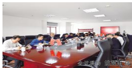
会议现场

的重大部署,是加强党的纪律建设、推动全面从严治党向纵深发展的重要举措。公司领导班子成员要带头学习、知纪明纪,作出表率,要对照党章党规找差距,把纪律和规矩挺在前面。各级党组织和广大党员要提高政治站位、主动对标对表,充分认识开展党纪学习教育的重要意义,深刻领悟“两个确立”的决定性意义,坚决做到“两个维护”,切实把思想和行动统一到党中央决策部署上来,高标准高质量开展党纪学习教育,以严明的纪律护航公司高质量发展。