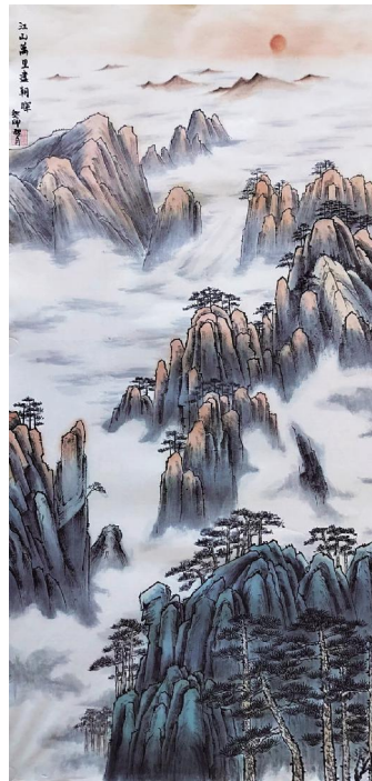
《江山万里书朝晖》高国红 画